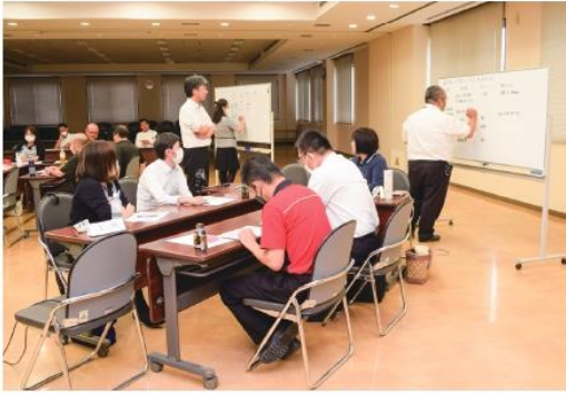
グループワークをする参加者

研修では不祥事の発生原因や事例等を学び、監督者全体で不祥事未然防止への意識を共有しました。また、組合員との対話をテーマにしたグループワークを行い、他部署の監督者と意見を交わすことで日々の業務に活かせる気づきを得ることができました。