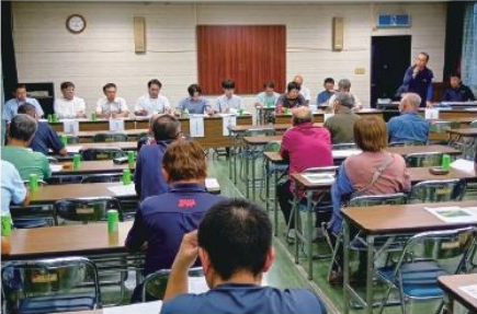
今年度の振り返りをする参加者

野菜センター運営委員会スイカ部会は9月19日、「藪塚こだま西瓜」反省会を藪塚野菜センター会議室で開催し、部会員36人や市場関係者、J A職員が参加しました。参加者は今年度の生産・出荷状況等を振り返り、次年度の出荷に活かせるよう話し合いました。次年度も生産者や市場、J Aで連携して出荷を行い、販売力を強化していくとして意思の統一を行いました。