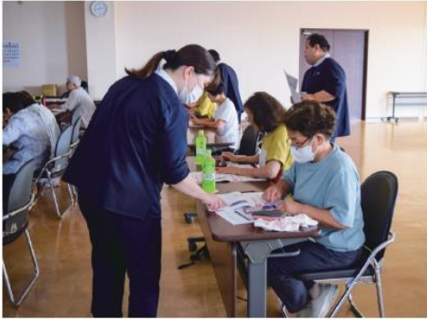
講師から操作を教わる参加者

教室ではNTTドコモの講師より、ネット検索の仕方やアプリ活用のための基本操作を説明しました。参加者は講師たちのサポートを受けながら実際にスマホを操作し、使い方を学びました。J A太田市では地域との繋がりを強化するために、今後も様々な講座やイベントを計画して参ります。