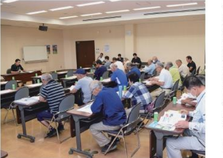
説明を聞く参加者

農畜産課は9月26日、小麦栽培講習会を本所3階大会議室で開催し、23人が参加しました。講習会では東部農業事務所の築瀬技師より、湿害対策やたんばく質含有量の向上等の栽培のポイントを説明しました。特に「カントリーの受け入れができなくなるので、赤かび病の対策をしてほしい」として、薬剤による防除や排水・湿害対策、残渣の処理等の総合的な対策を呼びかけました。また、資材メーカーより肥料や農薬の紹介も行いました。