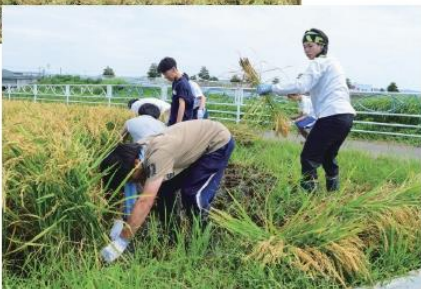
稲刈りに参加した学生