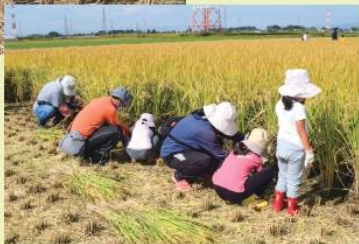
稲刈りを楽しむ参加者たち

9月26日、藪塚本町地区の田んぼで稲刈り体験学習が行われ、藪塚本町小学校と藪塚本町南小学校の小学5年生約200人が参加しました。地産地消や米作りに関心を持ち、作物の大切さなどを学んでもらおうと、地元農家などで結成する「藪塚地区米づくり体験学習事業委員会」が主催しています。 生徒は2人1組で力を合わせて、鎌を使った稲刈りに挑戦し、楽しみながら農業への理解を深めました。 体験学習は太田市の「1%まちづくり事業」の補助を受けており、同委員会と同市の協働事業になっています。またJA太田市も毎年、営農部の職員が指導に協力しています。 収穫した米は11月上旬に給食で両校と藪塚本町中学校で提供されました。