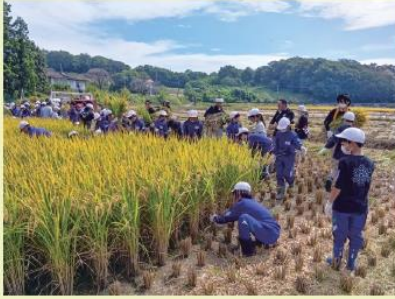
協力して稲を刈る生徒たち