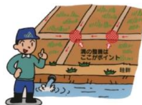
排水口へきちんとつなげる