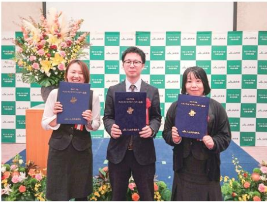
左から坂田担当、大平担当、吉澤担当