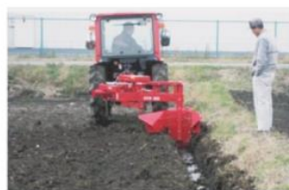
溝掘り機による溝掘り