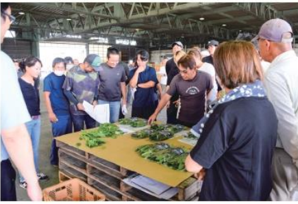
出荷規格を確認する参加者

園芸課は10月3日、藪塚野菜センターでハウスホウレン草の目揃え会を開催し、生産者74人が参加しました。 生産者は出荷規格に準じたホウレン草を見ながら、生産者同士や市場関係者J A職員と意見を交わすことで出荷規格を申し合わせました。 また、東部農業事務所の富樫技師より、べと病や炭疽病、平年に比べ発生が多発しているチョウ目害虫等について防除を呼びかけました。