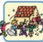
墜落などによる外力行為または暴行行為

※自然災害による損害は、建物内部での車両の衝突については、平成20年4月1日以後の契約の場合に適用します。