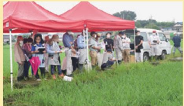
水稲栽培について研修を受ける参加者（宝泉地区）