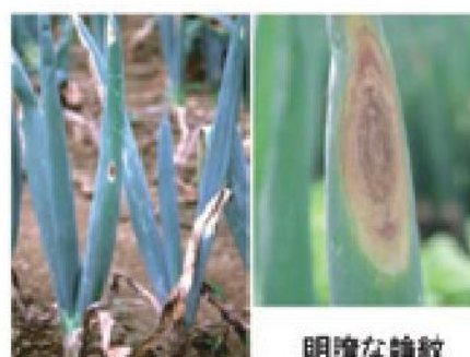
病斑と枯死した葉