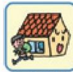
盗難による盗取、損傷または汚損