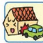
建物外からの物体の衝突または建物内部での車両の衝突