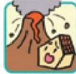
火山の噴火または爆発