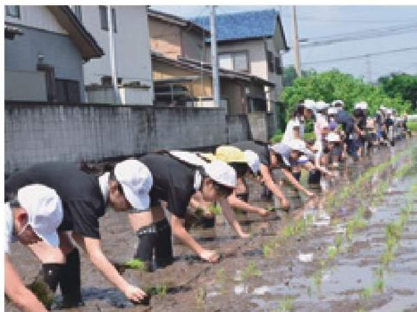
一生懸命苗を植える児童ら

営農サポート課は食農教育授業の一環として7月2日、太田市立沢野中央小学校で5年生1、2組の計63人で「あさひの夢」の田植え体験を行いました。