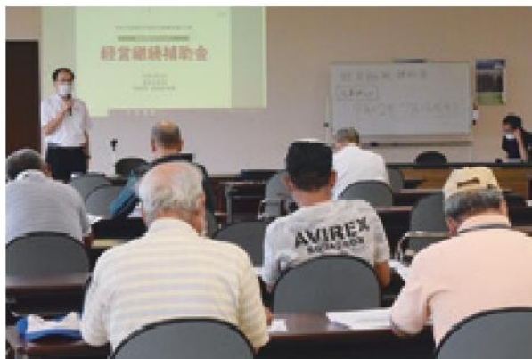
経営継続補助金の説明をする東部農業事務所の職員

説明会では、東部農業事務所職員を講師に招き、経営継続補助金の目的や補助要件などについて説明しました。また、新型コロナウイルス対策もしつつ、経営を継続していくために農業者の取り組みを支援する補助金の受付を7月10日～16日に本所2階で行いました。