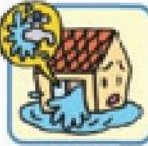
給排水設備に生じた事故による水ぬれ