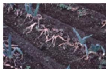
倒伏し枯死した株