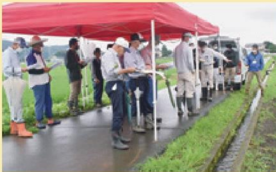
栽培管理について学ぶ参加者（強戸地区）

宝泉地区、沢野地区、毛里田地区、休泊地区、藪塚地区、強戸地区の6つの地区の圃場で計60人が参加しました。東部農業事務所の高山技師より「病虫害防除対策として梅雨が明けて気温が上がると乾燥して病虫害が増殖するので、定期的な防除をすること」と注意を促しました。参加者からたくさん質問や意見等があり、営農指導課の職員は今後の栽培管理についてアドバイスをしました。（P6、7参照）