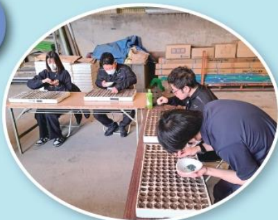
モロヘイヤの播種をする新入職員