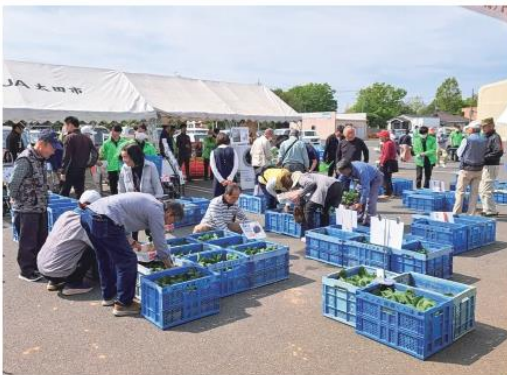
野菜苗を選ぶ来店者

また、城西の杜直売所と九合直売所ので毎年大好評の野菜苗販売では、展示即売会当日のみ特価で提供し、多くの人が買い求めました。春の暖かい日差しの中で、来店客は催しを楽しみ大盛況となりました。