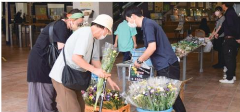
切り花を選ぶお客さま

ロビー市では太田市の産のモロヘイヤやナス、たまごなどを販売しました。お盆が近かったため、切り花も多く用意し、大変好評でした。多くのお客さまが訪れ、ロビー市は盛況となりました。