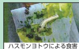
ハスモンヨトウによる食害