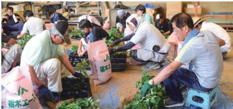
仮植をするイチゴ生産者

当日は沼田市で引き取りをした後、本所倉庫内でイチゴ生産者19人とJA職員、東部農業事務所職員で協力して約3000株を仮植しました。