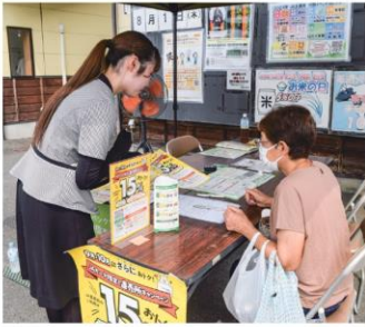
キャンペーンの案内をする職員

職員が直売所に立ち寄ったお客さまに声を掛け、J Aカードに関するアンケートを実施し、回答した方には粗品をプレゼントしました。また、J Aカードの契約や予約をした方にコップを贈呈しました。