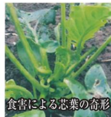
食害による芯葉の奇形