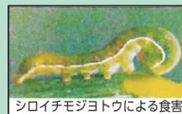
シロイチモジヨトウによる食害