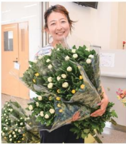
菊花を購入したお客さま

沢野支所では9月の彼岸にも菊花の販売を予定しております。今後もご利用者さまのための取り組みを続けていきます。