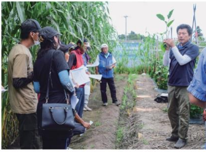
蓼沼技師の説明を聞く参加者

参加者は実際にV字樹形の管理などができている現場を見学しながら、説明を聞くことで、より理解を深めました。また、褐色腐敗病やハスモンヨトウなどの病害虫防除を呼びかけました。