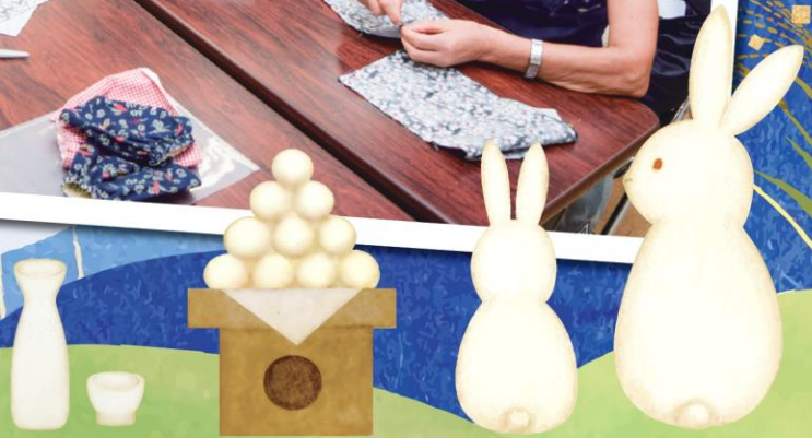
手芸教室で手甲づくり (P4)